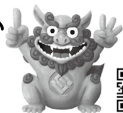
当社キャラクター イーサ君