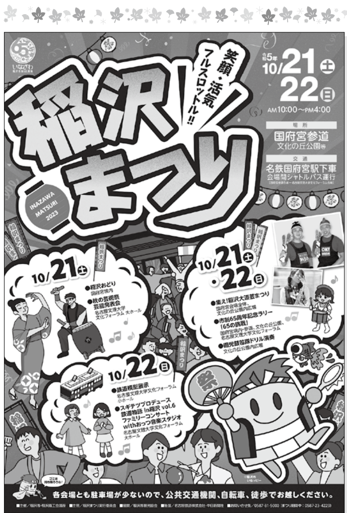
今年度「稲沢まつり」ポスター

発行所：稲沢商工会議所 発行人：池戸賢治 〒492-8525 稲沢市朝府町15-20 ☎<0587>81-5000 印刷所：(株)塚本印刷 毎月1日発行