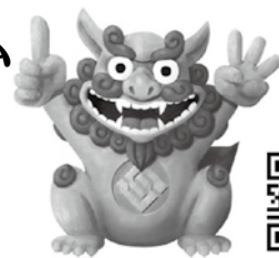
当社キャラクター イーサ君