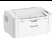
世界最小格安レーザー PANTUM P2500