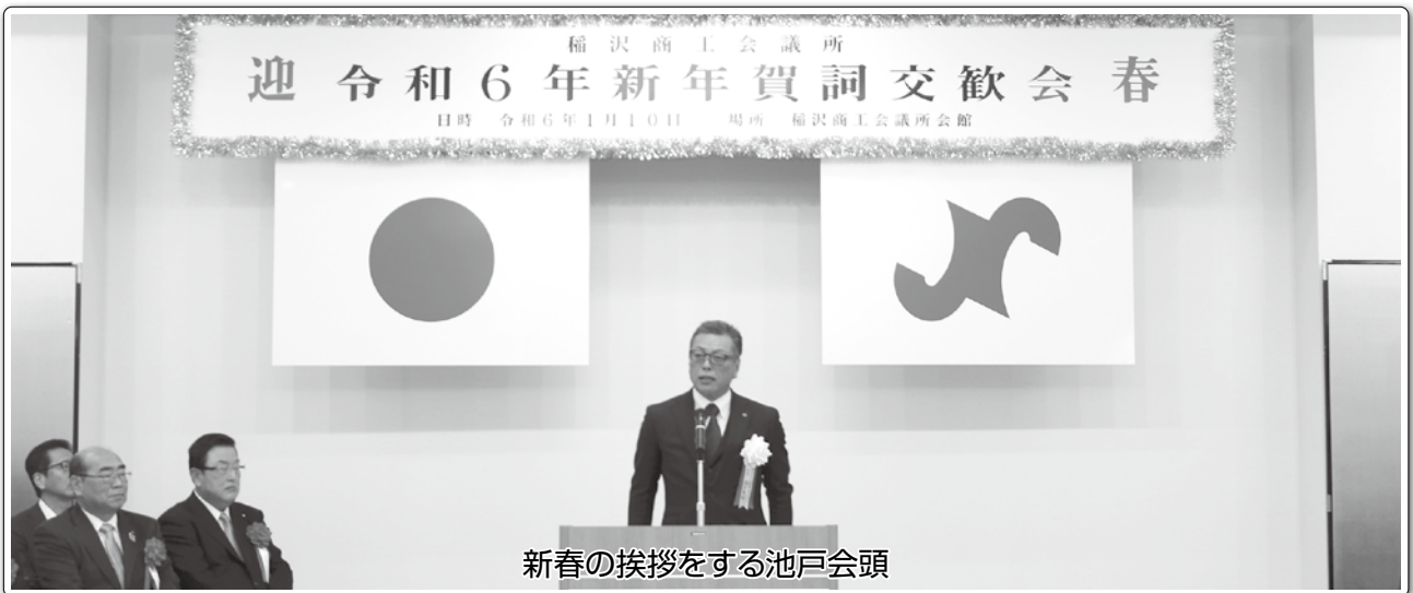
新春の挨拶をする池戸会頭

◆とき 令和6年1月10日(水) 午前11時～午後1時 ◆ところ 稲沢商工会議所会館