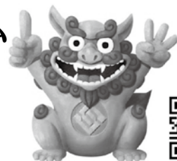
当社キャラクター イーサ君