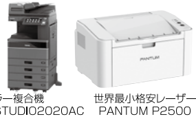
カラー複合機 E-STUDIO02020AC 世界最小格安レーザー PANTUM P2500

愛知県稲沢市東緑町 3-43 TEL.0587-81-4416 FAX.0587-81-4417