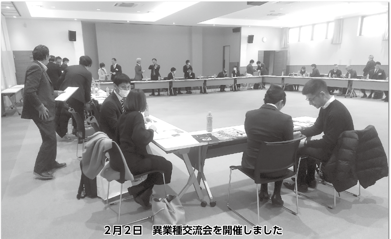
2月2日 異業種交流会を開催しました

発行所：稲沢商工会議所 発行人：池戸賢治 〒492-8525 稲沢市朝府町15-20 ☎<0587>81-5000 印刷所：(株)塚本印刷 毎月1日発行