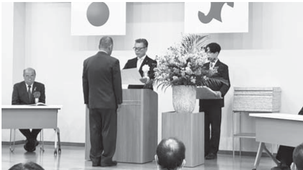
表彰状を授与される受賞者